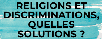
Table ronde ouverte au public