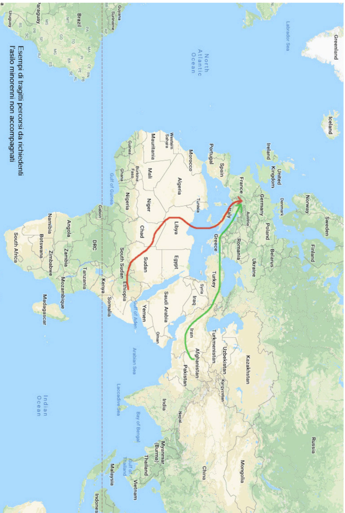
Esempi di tragitti percorsi da richiedenti l'asilo minorenni non accompagnati