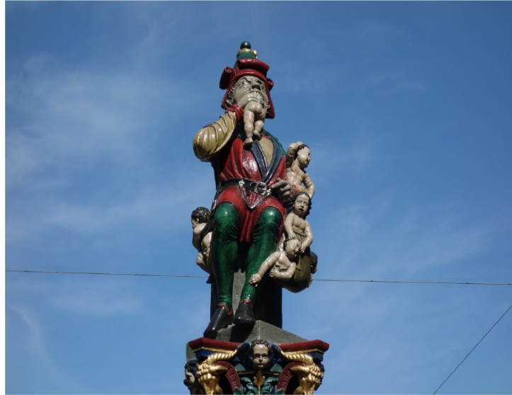
Kindlifresserbrunnen am Kornhausplatz in Bern, von Hans Gieng 1545.